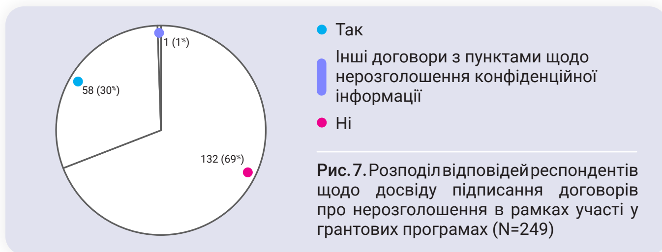
Рис. 7. Розподіл відповідей респондентів щодо досвіду підписання договорів про нерозголошення в рамках участі у грантових програмах (N=249)

Щодо досвіду підписання договорів про нерозголошення в рамках участі у грантових програмах, то більшість респондентів (69%) НЕ підписували такого типу договори, при цьому 30% мали такий досвід та 1% з числа опитаних підписували інші договори, в яких містились пункти щодо нерозголошення конфіденційної інформації (рис. 7).