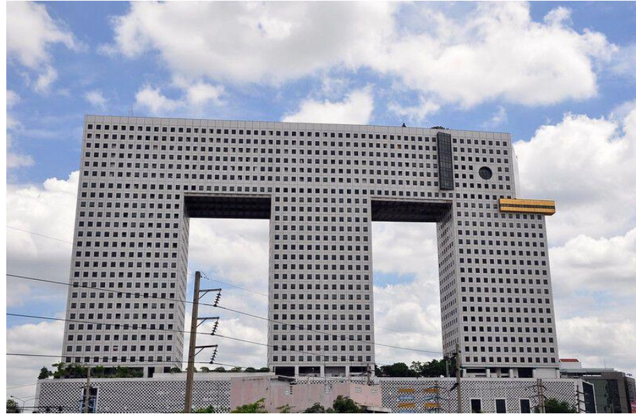
Будинок-слон у Таїланді. Архітектор Онгард Саграбхандху.